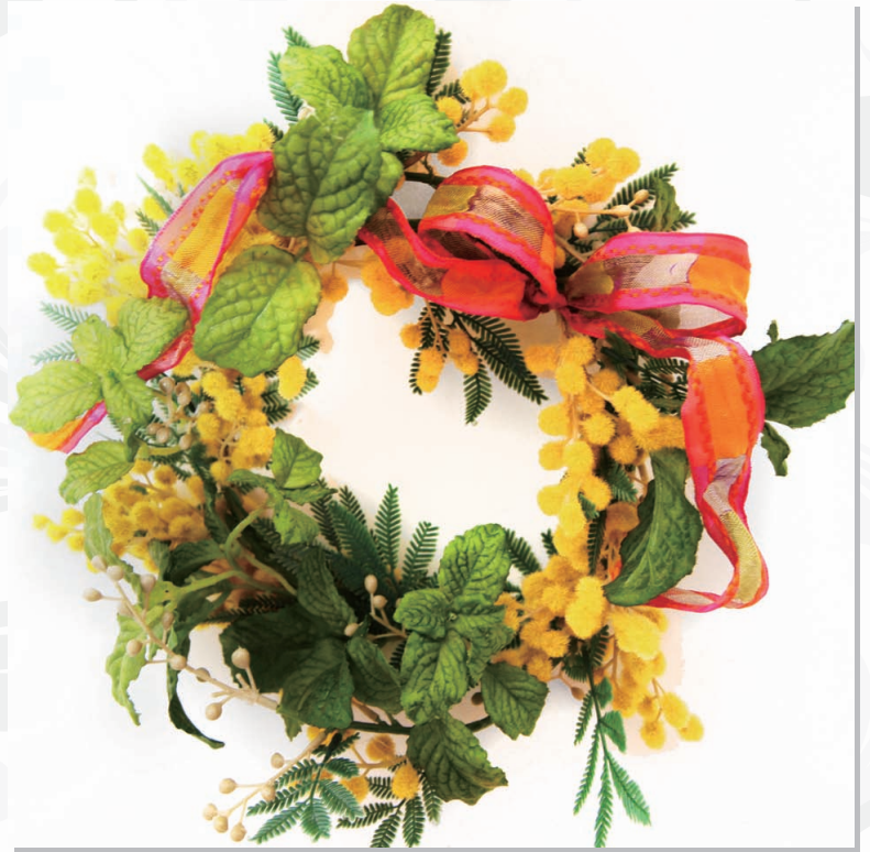
3月レッスンイメージ写真